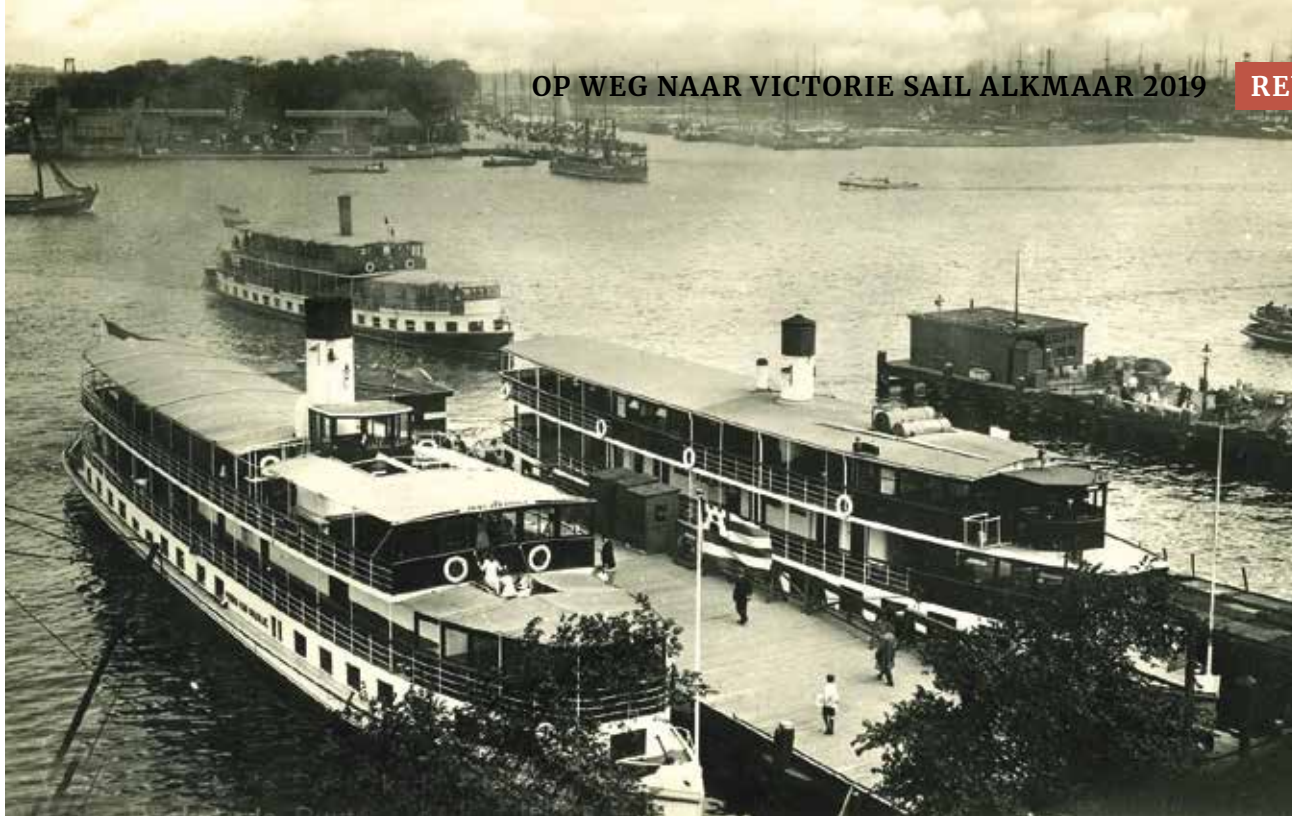
De Prins van Oranje en andere schepen van Alkmaar Packet aan De Ruyterkade, steiger 10, achter het centraal station in Amsterdam