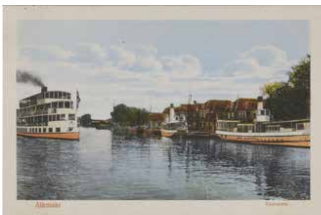
Alkmaar Packet, Voormeer 1920