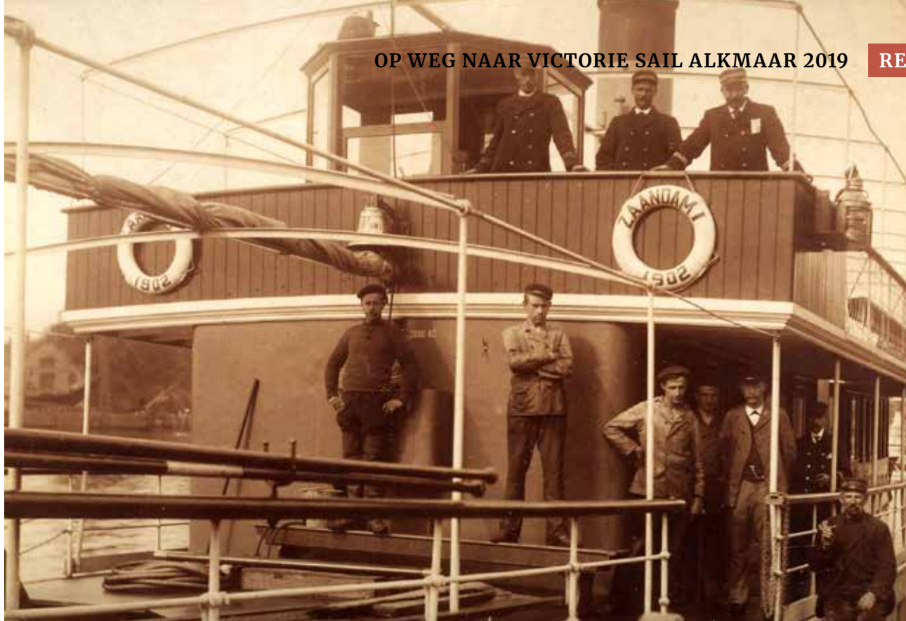
Personeel van de Zaandam 1 en walpersoneel in 1904.