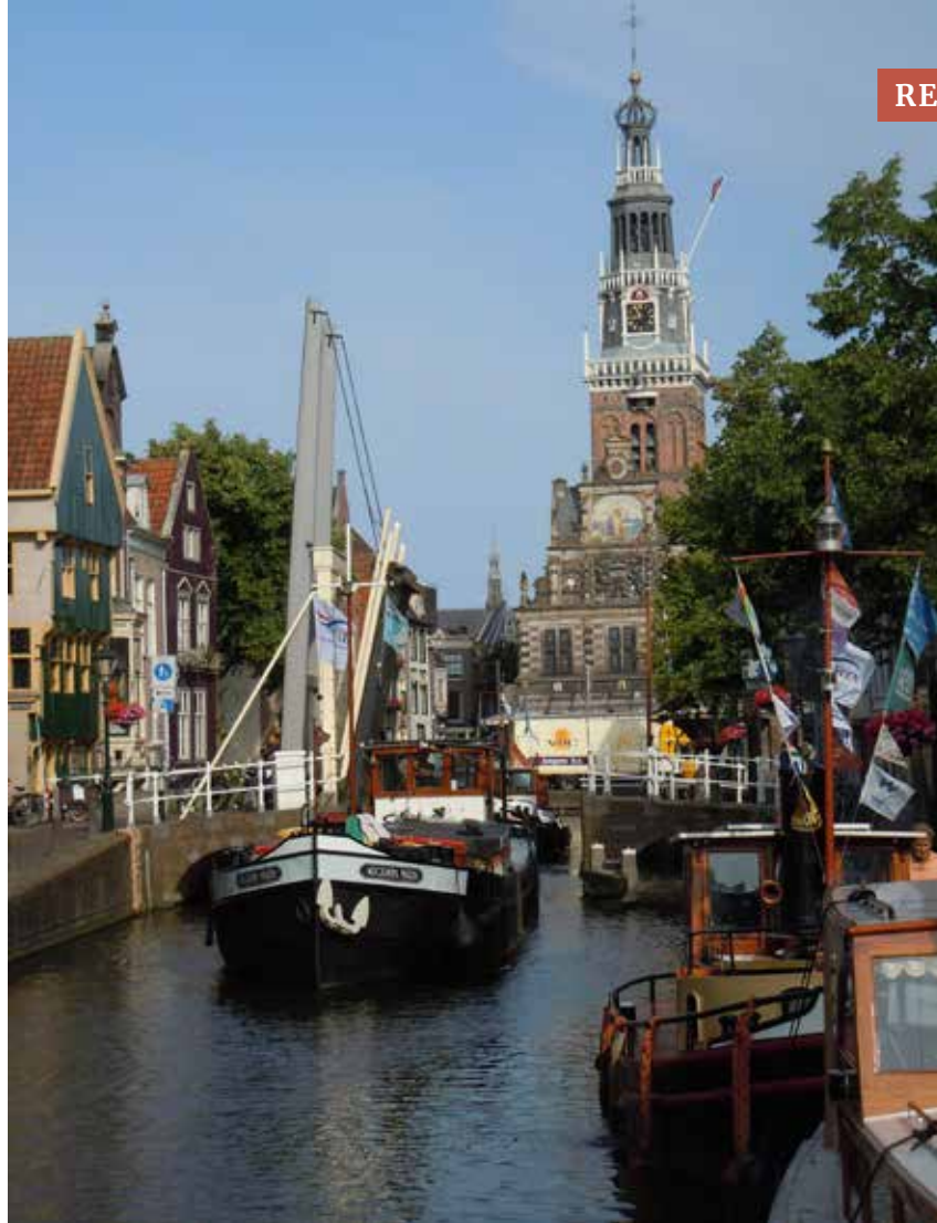
Augusta Maria in de stadsgracht Lutтик Oudorp met op de achtergrond De Waag Foto Trudy Boom

Tijdens de reünie in 2019 zal een deel van de schepen een ligplaats vinden in het Lutтик Oudorp en de Turfhaven, maar de meeste zullen een plaats krijgen in het Noord-hollandsch Kanaal dat om het oude centrum heen loopt