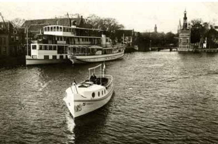
Packetschepen aan het Voormeer in Alkmaar met op de achtergrond de accijnstoren