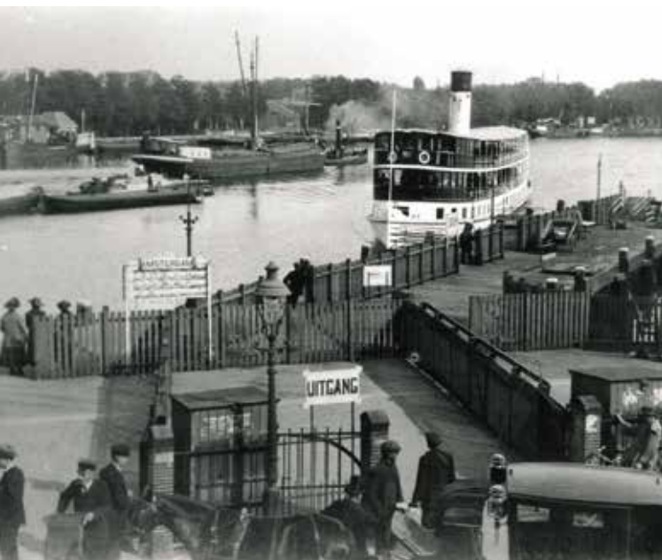
De Czaar Peter komt aan in Zaandam, 1936