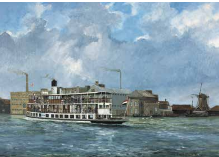
De Stierop bij Wormerveer, geschilderd door Fred Boom

uitspraak in het Zaaans geworden. Voor de mannen was wildplassen in die tijd blijkbaar nog heel acceptabel. Nadat er in 1945 veel bevrijdingsfeesten in de hoofdstad werden gehouden, werd het kermisverbod opgeheven. Maar de Alkmaar Packet vervoerde nog wel een tijdje hoofdstedelingen naar de Zaanse kermis. Zo zijn er vele roemruchte verhalen verbonden met de Alkmaar Packet.