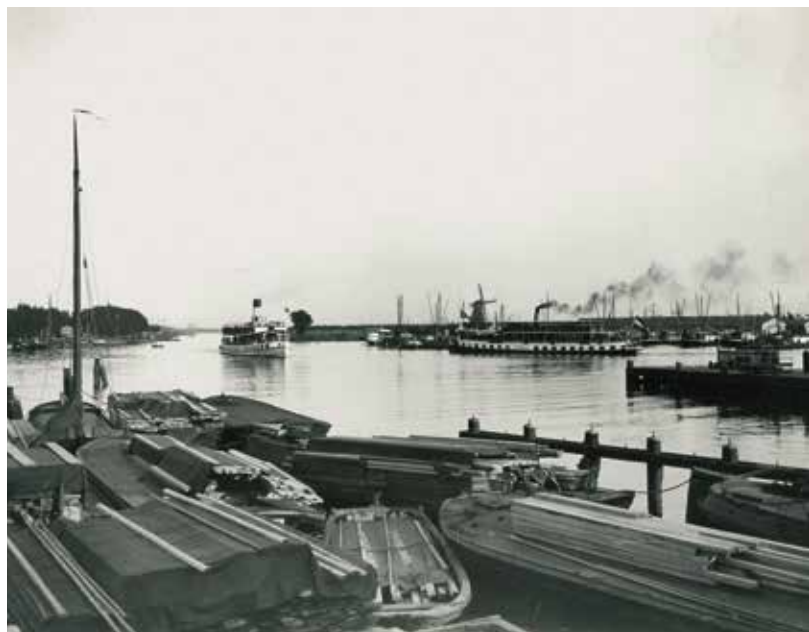
De Czaar Peter arriveert over de Voorzaan in Zaandam en rechts vertruikt Zaandam 2, jaren dertig